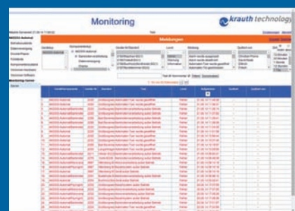
Übersicht der Meldungen

Die in dieser Unterlage enthaltenen Angaben und Daten können ohne vorherige Ankündigungen geändert werden. Die Darstellungen, Bilder und Screenshots sind Beispiele.