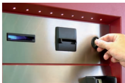
Akzeptanz mehrerer Zahlungsmittel