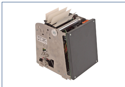
Lieferbar als OEM-Baugruppe