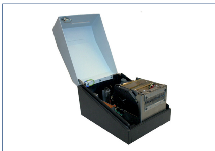
Nutzbar als Tischdrucker im Vorverkauf