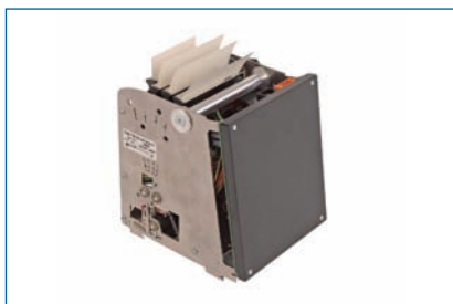
Als OEM-Baugruppe lieferbar