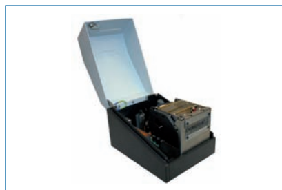
Als Tischdrucker im Vorverkauf nutzbar