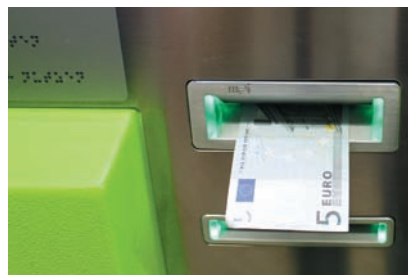
Vandalismussichere und formschöne Lösung